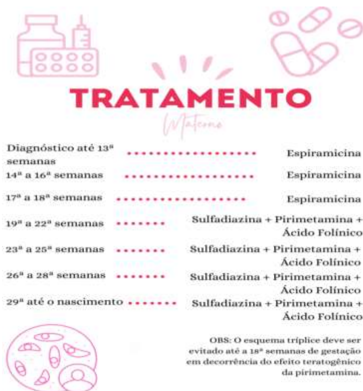
Tabela 04- Tratamento materno

Fonte: Adaptado de Ministério da Saúde, 2016.