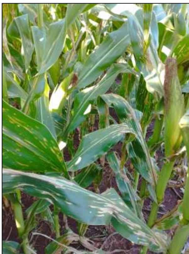
Figura 05 - Lavoura de milho em fase reprodutiva, apresentando grandes perdas por estria bacteriana, sendo cultivada em sucessão a aveia.

Com o início do desenvolvimento da cultura do milho, em sucessão há essas áreas de cultivo de aveia, notou-se que o desenvolvimento da doença foi acelerado em relação há áreas onde a cultura antecessora não é relativamente propensa ao desenvolvimento da estria bacteriana.