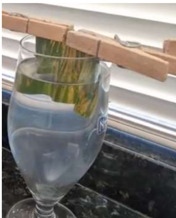
Figura 03 – Teste do copo para identificação de bacteriose em folha de milho.

Doenças. Tais componentes afetam diretamente a sobrevivência, disseminação, infecção, colonização e reprodução dos patógenos.