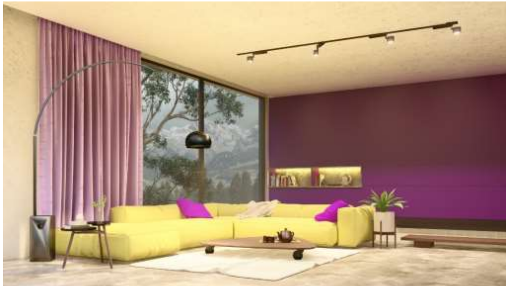
Figura 09 – Esquema de Contraste de Extensão