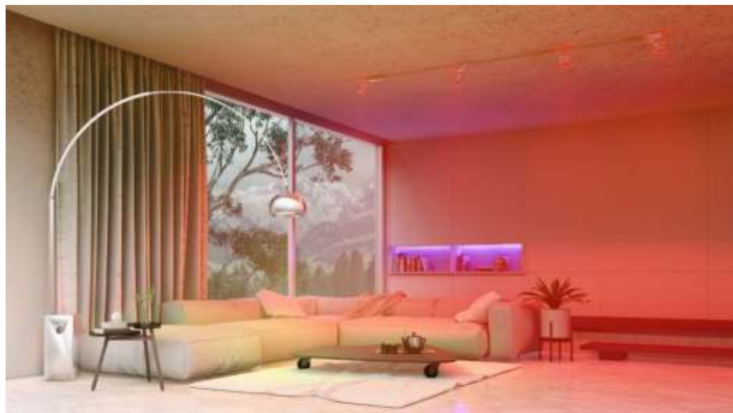
Figura 08 – Esquema de Contraste Simultâneo

O contraste simultâneo, faz uso de cores saturadas, porém, através da iluminação (BACELAR, 2021; GRIMLEY, 2007).