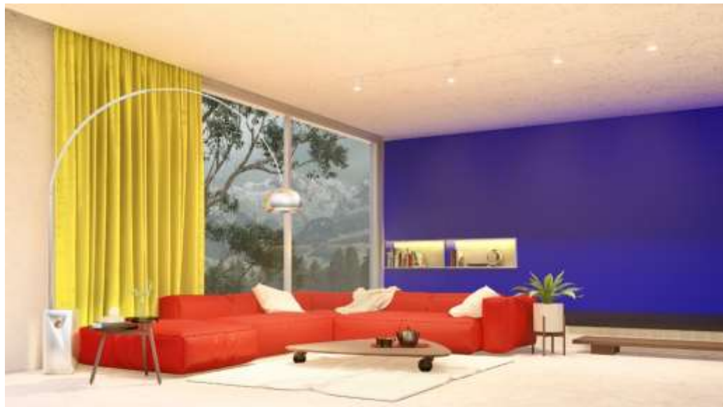
Figura 06 – Esquema Triádico

O Triádico faz uso de três cores equidistantes (cores que mantêm uma distância igual entre si no círculo cromático), aplicadas de forma saturada e vibrante (BACELAR, 2021; GRIMLEY, 2007).