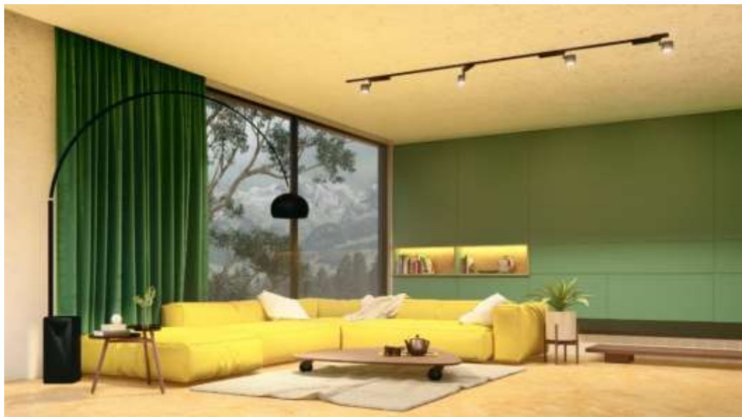
Figura 04 – Esquema Complementar

O esquema complementar, ou de temperatura, foca em transparecer a temperatura das cores, sejam elas quentes ou frias, como exemplo, podemos ter o contraste entre marrom (cor quente) e azul (cor fria) (BACELAR, 2021; GRIMLEY, 2007).